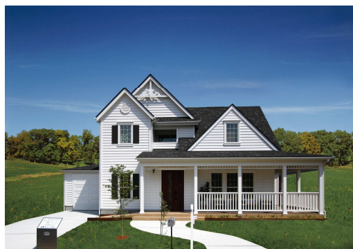
《GLホームの『ウッズヒル アーリーアメリカンスタイル』外観》

今回、GLホームでは、これらの問題解決の一つとして、標準の2×4工法の住宅価格据え置きのまま、