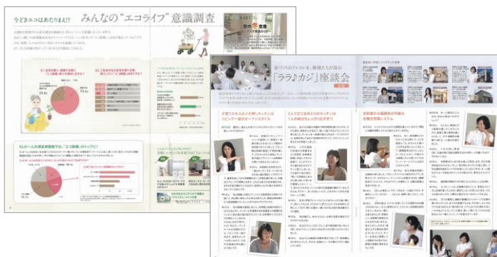
<意識調査や座談会を実施し、パンフレットで情報提供>