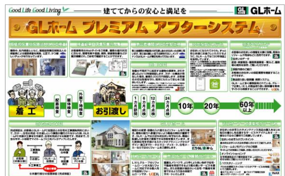
<GLホーム プレミアムアフターシステム>