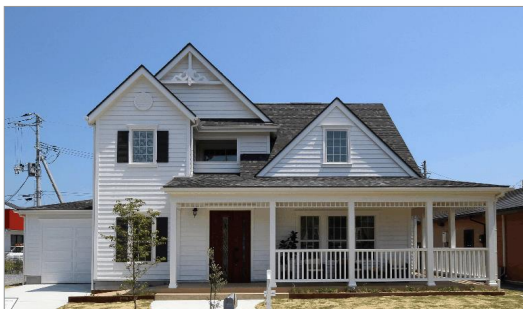
<「WoodsHill(ウッズヒル)」外観イメージ>

住まい手には、消費電力や太陽光発電状況を「見える化」し、エネルギー使用状況を把握できるようにすることで節電行動を促しています。また、GLホームのWEBサイトにお施主様専用ページを用意し、ご自宅の建物に関する情報を長期にわたりご提供したり、「GLホーム プレミアムアフターシステム」によりお施主様を生涯にわたってサポートするなど、永く住み続けられるよう工夫しています。さらには、住宅購入者のエコライフ意識調査やOBのお客様の座談会を実施。その取り組みをパンフレット等にまとめ広く情報提供を行っています。様々な取り組みで省エネ住宅の普及に取り組んでいます。