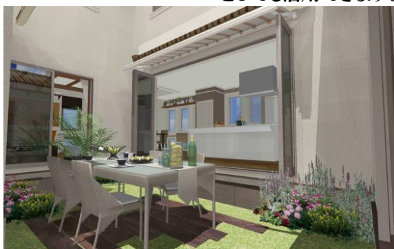
「ガーデンダイニング」