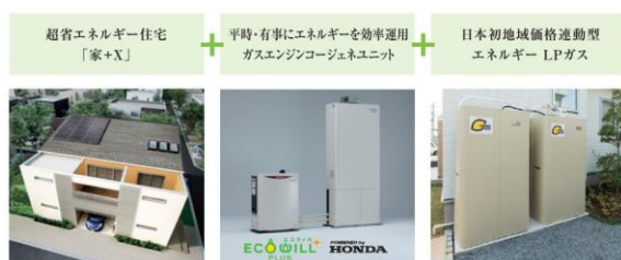
【写真1】HL 2 スーパーレジリエンスシステム

また、有事には災害に強いLPガスが、調理はもちろん、ガスコージェネレーションシステムの自家発電を使って、冷蔵庫・LED照明、テレビ、コンセントに約1kWの電気を供給することで、長期にわたる自立が可能になります(図1)。